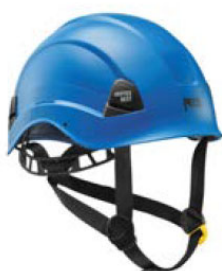
Figura 3. Casco con barbiquejo EN 397