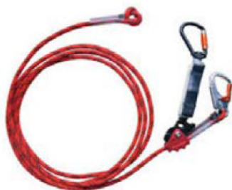
Figura 5. Dispositivos antica3das deslizantes sobre l3nea de anclaje flexible (cuerda) EN 353-2