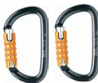
Figura 4. Conectores EN 362