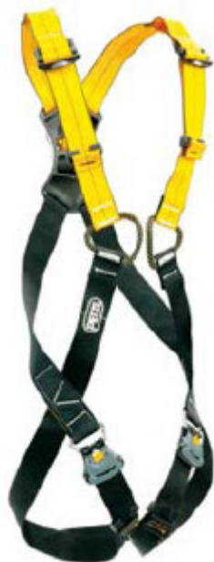
Figura 1. Arnés anticaídas EN 361